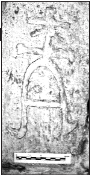
Im genes: Saet