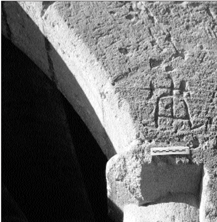
Señorita ubicada en el Ayuntamiento de Miravete

En la provincia de Teruel el Saet ha constatado su existencia en las localidades de Ababuj, Aguilar del Alfambra, Albentosa, Alcalá de la Selva, Alcotas, Aldehuela, Allepuz, Arcos de las Salinas, Cabra, Camarillas, Ca-